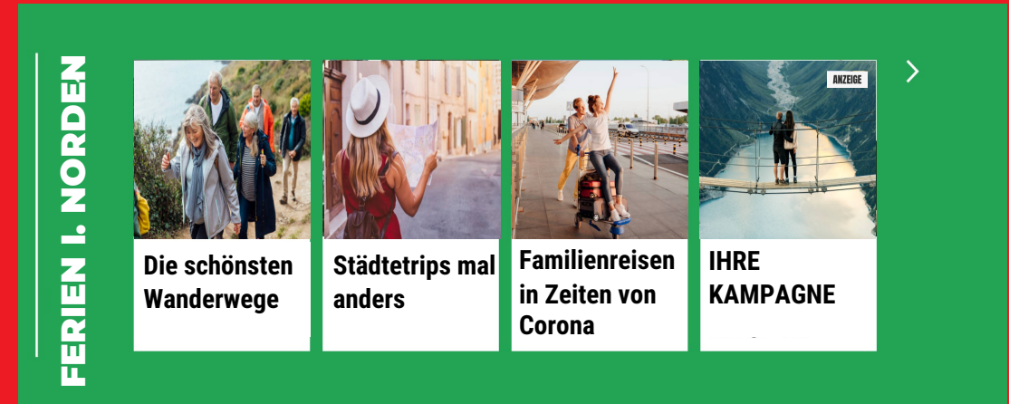
Slider „Ferien im Norden“